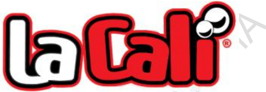
Figura 1. Empresa la Cali Vargas & CIAS. en C