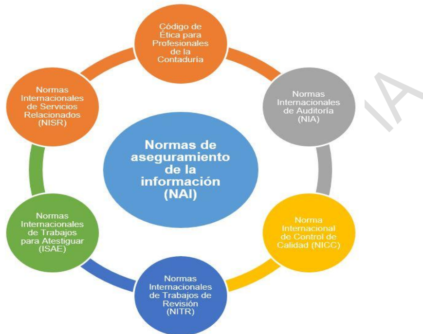
Figura 3. Normas de Aseguramiento