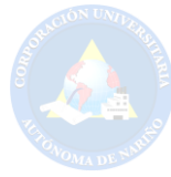
Tabla 6. Lista de chequeo