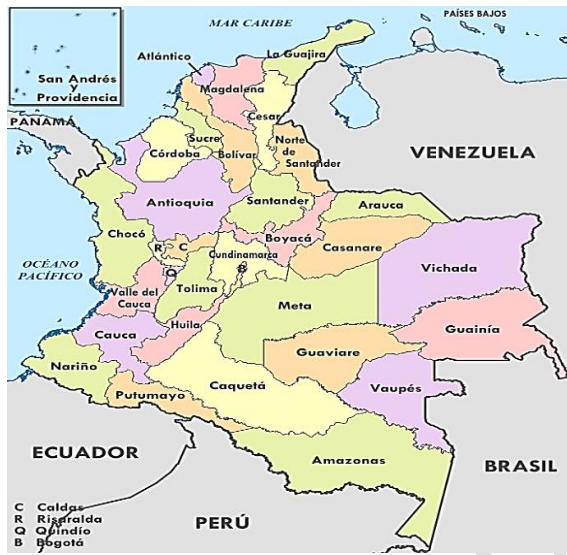
Figura 1: Mapa de la Republica de Colombia