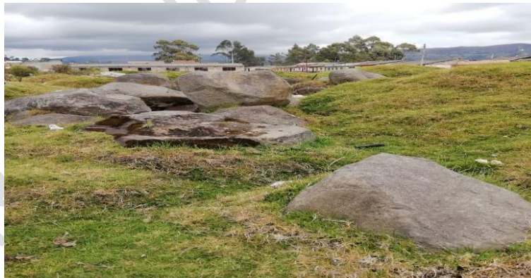
Figura 4: Sector Llano de Piedras