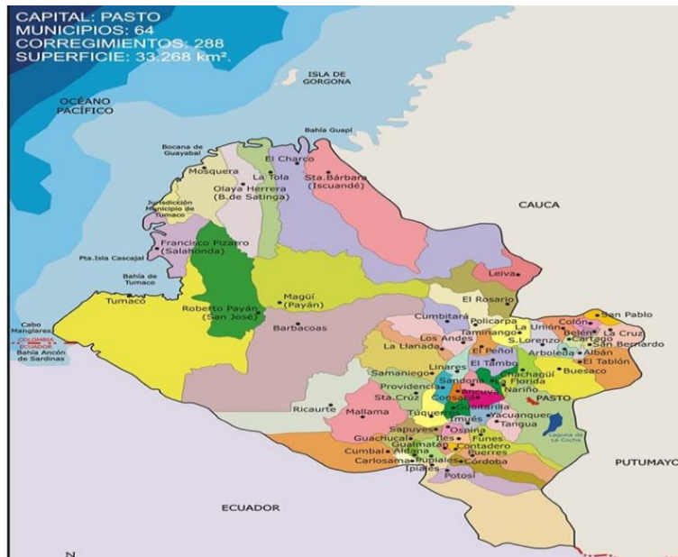
Figura 2: Mapa del Departamento de Nariño